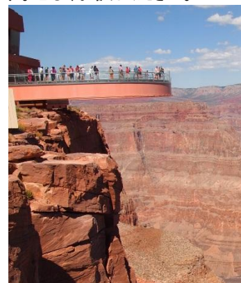
グランドキャニオンの 展望橋アトラクション「スカイウォーク」

「スカイウォーク」がモチーフの キャットフィッシュフライをドーン！ とトッピング