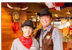
カウボーイ・カウガールが明るくお出迎え

今後も質の高い肉料理や充実したサラダバーを提供し、我が家のホームパーティーにお招きしたようなサービスで、地域の皆様楽しんでいただけるレストランとなるよう努めてまいります。