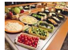
20種類以上楽しめるサラダバー