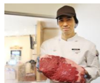
肉は、コックが1枚ずつ丁寧に店内でカット